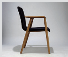
しなる背もたれ GINA Dining Chair