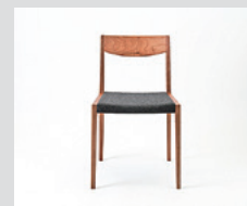
とてもシンプルなチェア HAKU Dining Chair