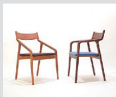
軽さと座り心地が魅力 PePe Dining Chair