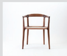
驚きの軽さ DC10 Dining Chair